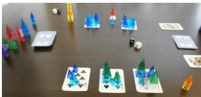
Exemple de développement des conspirations au début d'une partie

Chacune est décrite en détails ci-dessous.