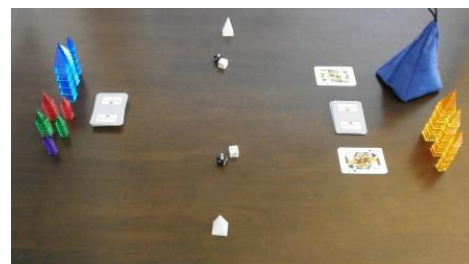
Configuration initiale d'une partie : les deux maîtres secrets sont des rosicruciens... peut-être.

Chaque joueur choisit secrètement une grande pyramide blanche ou noire pour représenter son maître secret (MS). Les petites et moyennes pyramides blanches et noires sont toutes placées dans le sac opaque. Chaque joueur tire alors aléatoirement une petite pyramide du sac, l'observe secrètement et la cache sous son MS. Cette combinaison est alors posée en empilement sur la table. La petite pyramide indique l'ALIGNEMENT INTÉRIEUR ou réel du MS et la grande donne l'ALIGNEMENT EXTÉRIEUR ou apparent. Il est possible que les joueurs aient le même alignement intérieur ou extérieur, ou les deux ! Ils connaîtront